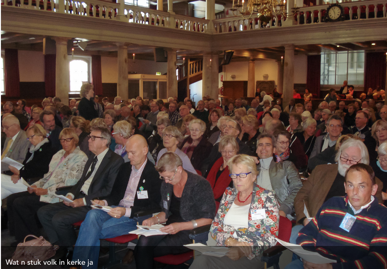
Wat n stuk volk in kerke ja

ze nait in steek te loaten. Wie bidden veur minsen in ons stad dai hier zunder geldige verbliefspapieren binnen, zai binnen ja nait minder as wie. Wie vroagen Joe om heur te helpen. Zo bidden wie ook veur 't Wereldhuus woar ze deur kerken holpen worden. Loat ons geleuf gruien zodat wie ons nait veur onszulf schoamen huiven. Maok ons geduldeg en verdroagzaam in omgang mit nkander. Joe binnen ja ook geduldeg en verdroagzaam mit ons. Doarum roupen wie Heer aan om ontfaarmen.