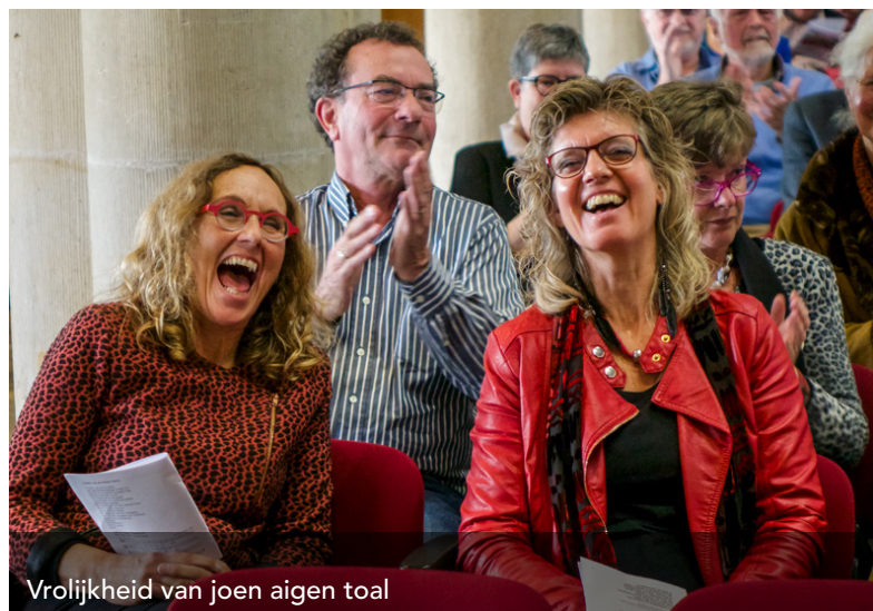
Vrolijkheid van joen aigen toal

Loat aanderen mor zeggen davve stoer boegen kinnen en stieve koppen hebben, as lu mor van joe op aan kinnen."