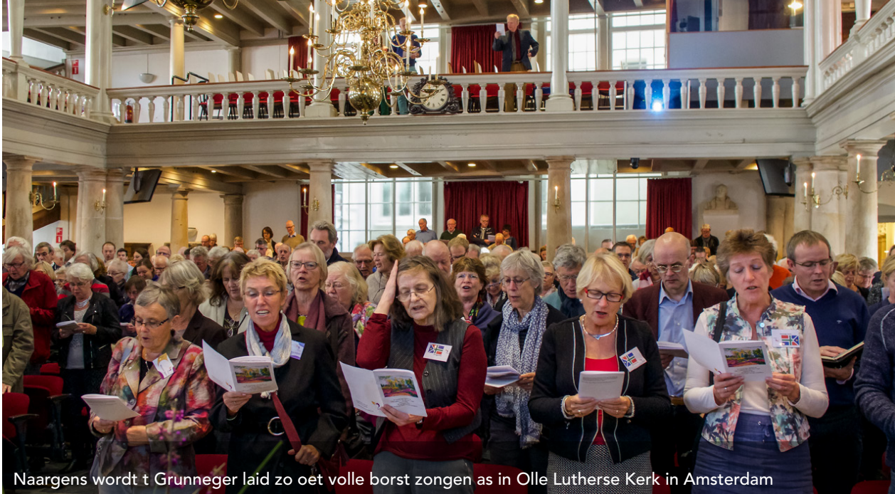
Naargens wordt t Grunneger laid zo oet volle borst zongen as in Olle Lutherse Kerk in Amsterdam