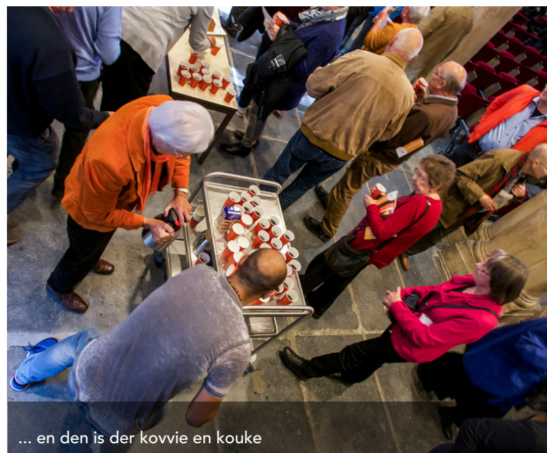
... en den is der kovie en kouke

Responsie deur gemainte: Heer, ontfaarm Joe