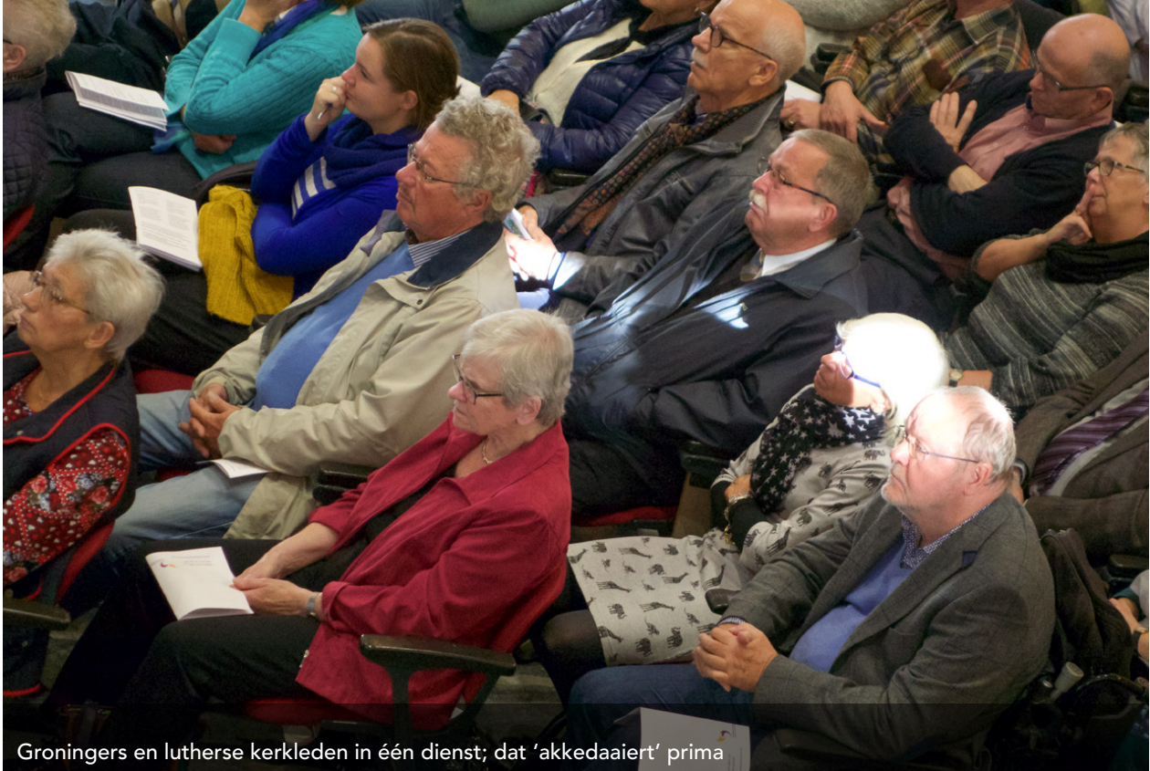
Groningers en lutherse kerkleden in één dienst; dat 'akkedaaiert' prima

is wisse van zien roupen. Zo gaat dat met minsen. Wie binnen ja moar n kôrte tied op oarde, in dizze wereld. Biebels sproken, binve vrumden en biewoners, n soort immigranten dai nooit oarden, nooit aigen worren. Wie binnen pelgrims, wie binnen roupen. Wie binnen wied van huus. Moar wie binnen op pad en kommen nait vaaste te zitten. En onderwegens trek ve ons op aan nekander. Wie steunen mekoar. Joa, wie hebben ook ons doel as pelgrims, moar tiedens t raaizen wodt t dudelk dat t om de weg zulm gait. Doar wodt leeft en naargens aans. Oabram huil zien doel messchain nait, moar toch het hai zien bestemmen vonden. Dat laand van belofte bleek zien nije voaderland. En in t inde guide hai uut tot n groot volk. Hai dai roupen was, wui tot zegen.