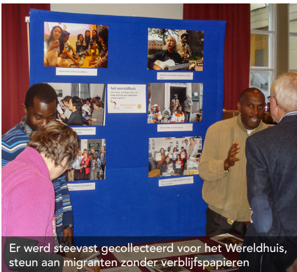
Er werd steevast gecollecteerd voor het Wereldhuis, steun aan migranten zonder verblijfspapieren