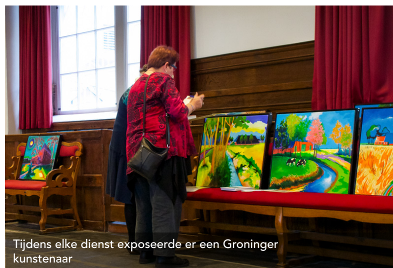
Tijdens elke dienst exposeerde er een Groninger kunstenaar