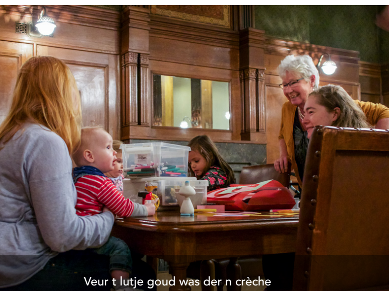
Veur t lutje goud was der n crèche

Oabram ging ook weg uut zien laand noar n ander laand. Hai heurde n stem dij hom ruip. Dai stem beloofde hom n aander laand, n laand woar t beter was den in zien aigen laand. Oabram haar direct deur dat t nait zien aigen stem was, moar stem van God. Dai stem, dai roup vertraauwde hai en hai gong op pad. Toun hai der was, baauwde hai n altoar veur de Heer zo bliede was e. Oabram haar moudveren om weg te trekken uut zien vertraauwde omgeven en Gods roup te volgen. Hai was nait heurig, nait benaauwd veur nije ruimte dai veur hom lag. Hai was doar op zien stee. Hollandse schilder Pieter Lastman het dat moment oafbeeldt. In t nije testament krig Oabram een pluumpie van schriever van braif aan Hebreeën. t Wodt hom tot gerechteghaid rekend dat hai noar roupstem luusterd het en dat hai op weg gong zonder te waiten woar e oetkommen zol. En dou e nait alles te zain kreeg wat hom beloofd was, hef e nait twievelt. Hai