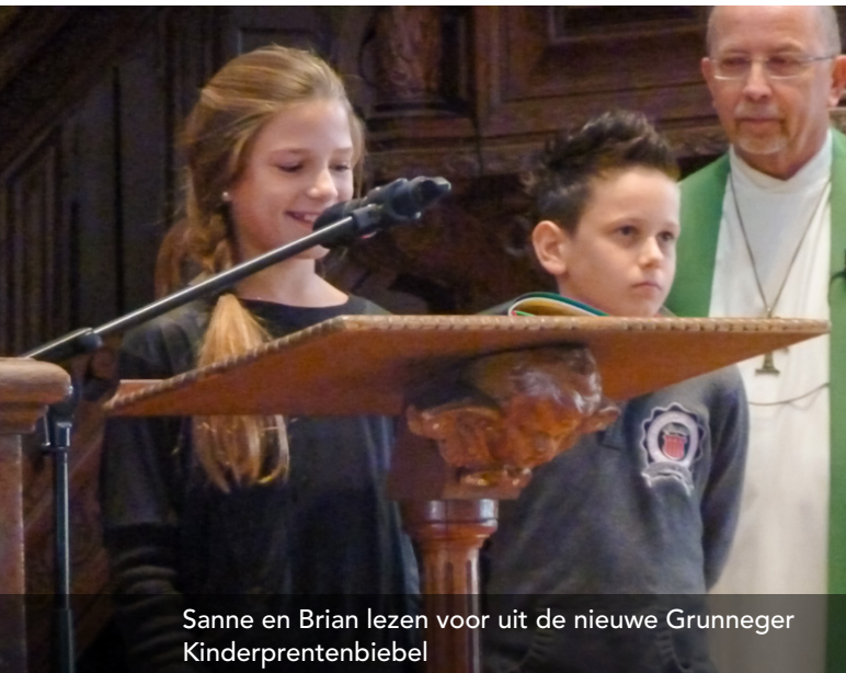
Sanne en Brian lezen voor uit de nieuwe Grunneger Kinderprentenbiebel

De samenwerking met de Liudger-stichting heeft mooie momenten opgeleverd. Zo werd in 2008 de nieuwe Grunneger Biebel , na eerst op zaterdag in de Martinikerk in Groningen officieel te zijn gepresenteerd, op zondag in onze dienst door voorzitter en secretaris van de Liudgerstichting aangeboden aan 'het westen'. Later is dat ook met het liedboek: Psaalms en Gezangen en de Grunneger Kinderbiebel gebeurd.